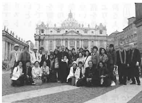
サン・ピエトロ広場にて